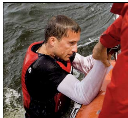
■ Nawet niedługi pobyt za burtą powoduje u rozbitek spory stres i dlatego ważny jest czas, w jakim uda się nam wyciągnąć z wody